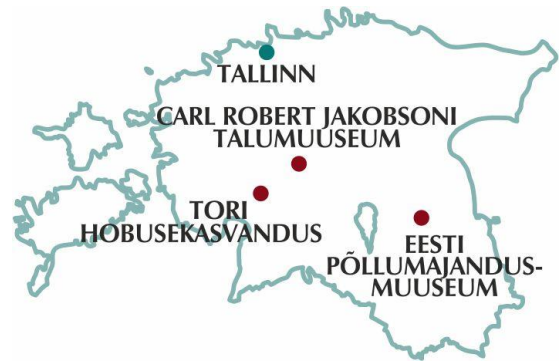
Joonis 1: SA Eesti Maaelumuuseumid asukoht

Sihtasutus kogub, säilitab, uurib ja vahendab Eesti põllumajanduse ajalooga seotud materjali hariduslikel, teaduslikel ning elamuslikel eesmärkidel ja tagab Eesti põllumajandusajaloo ja kultuuripärandi seisukohast märgilise tähtsusega C. R. Jakobsoni Talumuuseumi, Eesti Põllumajandusmuuseumi ning Tori